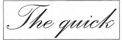
弊社のソフト「Font to logo」 上での刻印イメージ