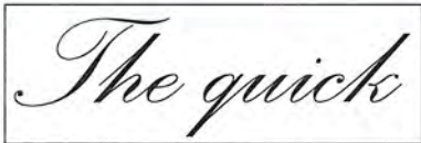
「Illustrator」や「Corel Draw」 上での印刷イメージ

「Illustrator」や「Corel Draw」と同様のフォントバランスで(文字の大きさ、間隔、スペース)しかも効率よく刻印できます。